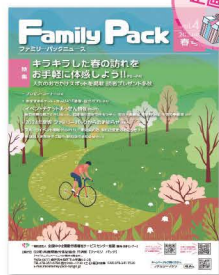
会報誌ファミリーパックニュース (年4回発行)