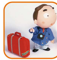
旅行代理店 (補助あり)