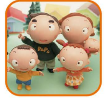
その他生活関連 (補助なし)