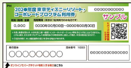
コーポレートプログラム利用券

東京ディズニーランド®/東京ディズニーシー®のパークチケットの購入やディズニーホテル宿泊にご利用いただける利用券です。