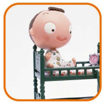
ホテル・旅館等 (補助あり)