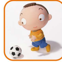
スポーツ・レクリエーション施設 (補助あり)