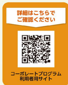
コーポレートプログラム利用者サイト