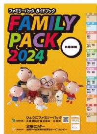
ファミリーパックガイドブック (兵庫県版・年1回発行1名に1冊)