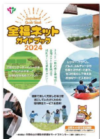
ファミリーパックガイドブック (全国版・年1回発行・20名に1冊)